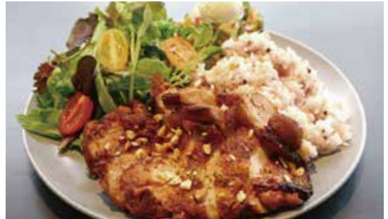
有田鶏の ドリンクセット ¥1,300 スパイシーグリルプレート (単品¥1,200)

香ばしいタンドリースパイスでローストした有田鶏は柔らかくてジューシー。お皿に添えたスパイスペーストとの相性も抜群です。十五穀米と唐津野菜とアボカドのサラダが身体に嬉しい、ランチプレートです。