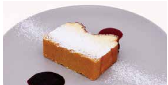
ベイクドチーズケーキ — 自家製ベリーソース添え — ドリンクセット ¥700 ~ (単品 ¥550) 爽やかにレモン香る自家製濃厚ベイクドチーズケーキ。