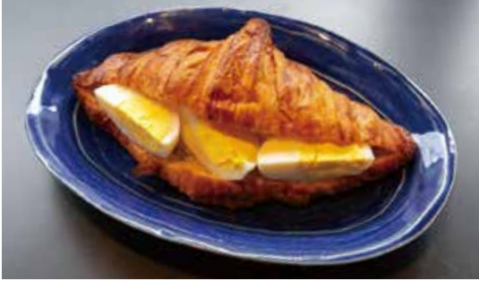
みのり農場の たまごサンド