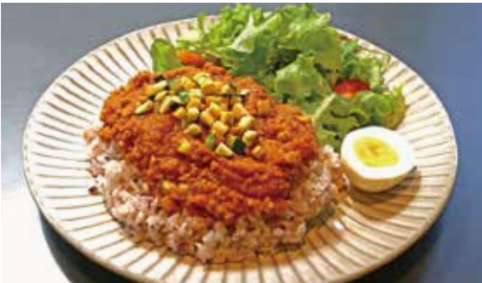
さくらポークと ドリンクセット ¥1,200 季節野菜の特製キーマカレー (単品¥1,100)

佐賀県産の肥前さくらポークを使用。甘味があり、あつさりとした豚ひき肉と、唐津で採れた季節野菜の旨味とじこめ、こだわりスパイスで仕上げました。みのり農場のゆで卵がベストマッチな、KARAE TABLE 自慢のキーマカレーです。