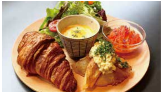
クロワッサンと ドリンクセット ¥1,000 唐津野菜4種のデリプレート (単品¥900)

お店でベイクドした香り豊かなクロワッサンと、唐津野菜をふんだんに使用したサラダ、キャロットラペ、フライドポテトと唐津焼で楽しむ季節の唐津野菜のポタージュがついた4種の野菜デリプレートです。