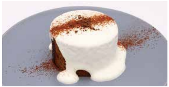
自家製 ロールショコラシフォン ドリンクセット ¥750 ~ (単品 ¥600) ベリーをしのばせたシフォンにたっぷりクリームをかけて。