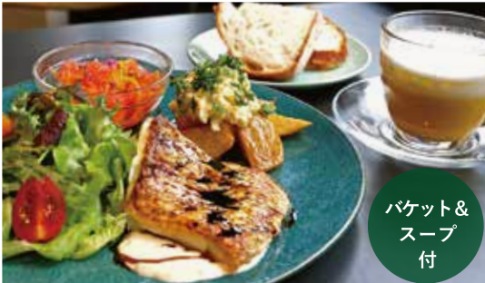
玄海町産穂州鯛のポワレと ドリンクセット ¥1,600 唐津野菜デリの贅沢プレート (単品¥1,500)

じっくり時間をかけて育てられ、鯛本来の旨味と甘みが楽しめる玄海町産「穂州鯛（ほしゅうだい）」を皮はパリッ、身はふっくらポワレに。唐津野菜を使用した自家製デリとバケット&季節の唐津野菜のポタージュがついたランチ限定贅沢プレートです。