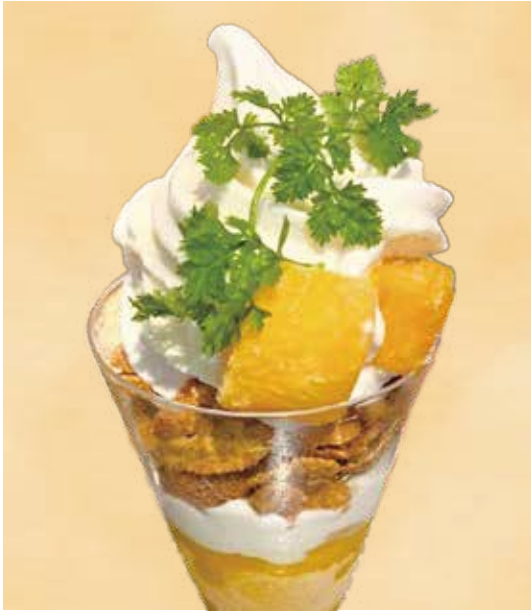
季節のパフェ — マンゴー — ドリンクセット ¥1,350 ~ (単品 ¥1,200)

ジューシーなマンゴーを主役に、村山牛乳のソフトクリーム、チョコシフォン、パンナコッタ、自家製スムージーを贅沢に詰め込んだ季節限定のパフェです。