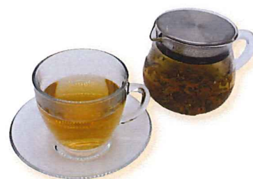
ハーブティー カモミール＆ラベンダー 400

香り豊かなセイロンティーに フレッシュなレモンを添えた、 シンプルなレモンティーです。 お好みで果汁をお絞りください。