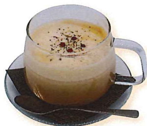
ホットマサラチャイ 500

甘いミルクティーにジンジャーと 数種類のスパイス、ペッパーを効か せました。身体がぽかぽか温まる 特製のマサラチャイです。