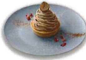
モンブランタルト ドリンクセット 700 ( 単品 550 )