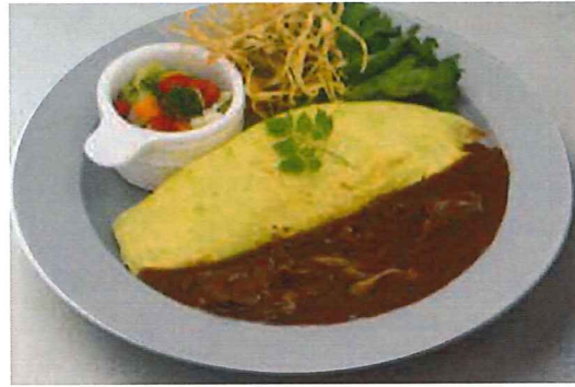
唐津にあるみのり農場のたまごを贅沢に2つ使用した 特製オムライス。自家製ピクルス&根菜チップスを添えて。