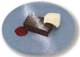
テリーヌショコラ ドリンクセット 750 (単品 600)