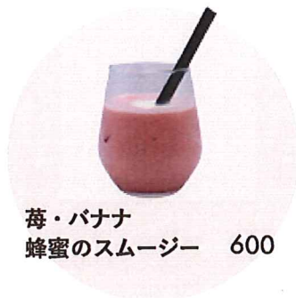
苺・バナナ 蜂蜜のスムージー 600