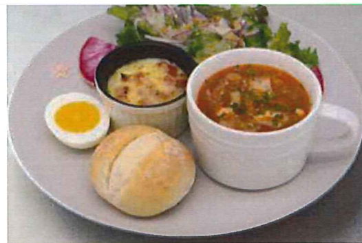
唐津産のお野菜をたっぷり使い、コトコト煮込んだ自家製 ミネストローネのスープランチ。パン or 十五穀米が選べます。