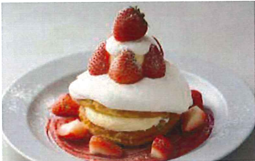
ストロベリーと ドリンクセット 1,350 ミルクークリームのパンケーキ (単品1,200) 苺をふんだんに使い、なめらかな口どけのミルクークリームを たっぷりトッピング。バニラカスタードがアクセントに。