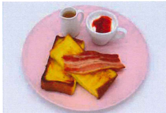
フレンチトーストセット + 1drink

トーストに自家製バターホイップ、みのり農場のゆで卵、ミニサラダ、ベーコンがついたセットです。