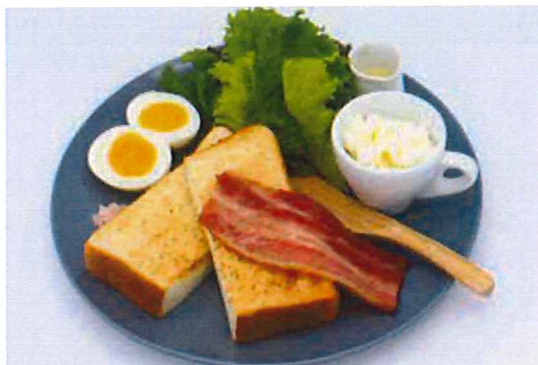
モーニングセット + 1drink