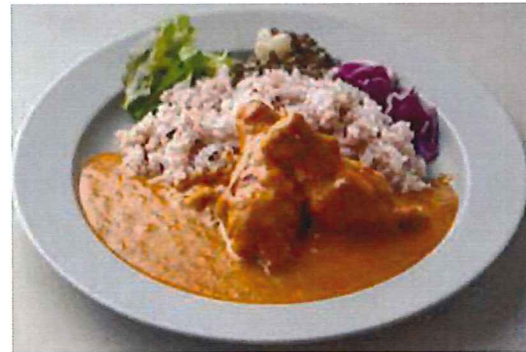
食欲をかきたてるスパイシーな香りに骨付きチキンのうまみが最大限に引き出された KARAE TABLE オリジナル自慢のカレーです。