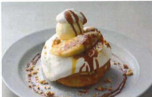
バナナと ドリンクセット 1,350 リコッタクリームのパンケーキ (単品 1,200) カリッとキャラメリゼしたバナナとリコッタチーズが入った生クリームを添えました。エスプレッソソースをかけてお召上がり下さい。