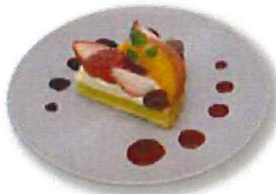
フルーツタルト ドリンクセット 700 ( 単品 550 )