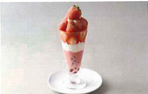
ストロベリーとタピオカの ドリンクセット 1,150 ポンポンパフェ (単品1,000) 大粒の苺をふんだんに使用し、自家製の冷たいスムージーはヨーグルト入りであっさりと。苺の甘酸っぱさとのバランスが絶妙。