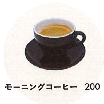
モーニングコーヒー 200