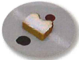
ベイクドチーズケーキ ドリンクセット 700 ( 単品 550 )