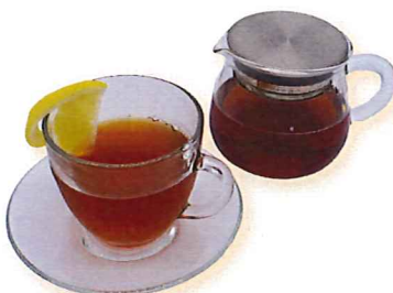
ホトレモンティー 400

※チャイはハチミツとスパイスを使用。アレルギーに 敏感な方、妊娠中の方は控えくださいませ。