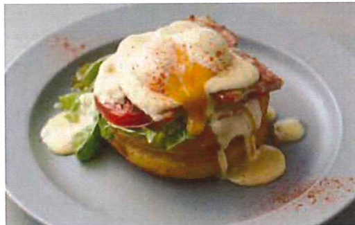
エッグベネディクト ドリンクセット 1,130 パンケーキ ( 単品 980 ) もちっりふわっとしたパンケーキは、卵黄、バターとレモン汁で作るオランダーズソースと相性抜群。ベーコンのソーデーとボーチドエッグをのせて。

※ パンケーキ、ボンボンパフェ、エッグベネディクトはお作りするのに 15 分程度お時間をいただきます。