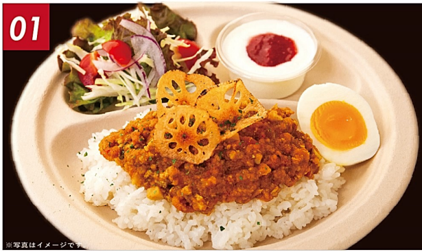
01 おくんち特製キーマカレー贅沢プレート ¥1,200 佐賀県産の肥前さくらポークを使用。こだわりのスパイスと豚ひき肉、放し飼いで卵と一緒に。ミニサラダ、ヨーグルトつき♪