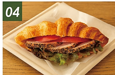
04 唐津野菜のバストラミサンド ¥700 水耕栽培の唐津野菜とフレッシュなトマト、肉厚でほどよく塩味のきいた鴨のバストラミの特製サンド。