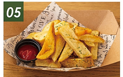
05 フライドポテト ¥550 小さなお子様から大人まで、みんなに人気のフライドポテト♪ 外はカリッ、中はホクホク。