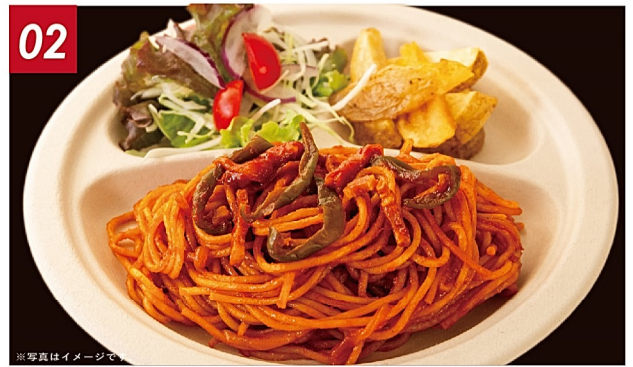
02 おくんち特製ナポリタン ¥1,200 ベーコン・玉葱・ピーマンをケチャップでからめた、懐かしい味わいで定番人気の皆大好きナポリタン。お好みで粉チーズを。ミニサラダ、フライドポテトつき♪