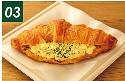
03 みのり農場のたまごサンド ¥700 唐津の「みのり農場」で大切に育てられた卵を使用。自家製フィリングをたっぷり挟んでいます。