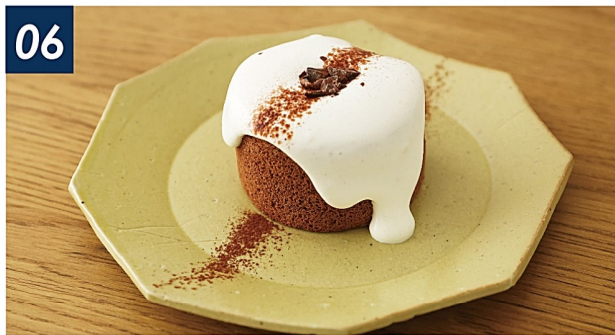
06 自家製ロールショコラシフォン ¥700 ベリーをしのばせたしっとりシフォンにたっぷりクリームをかけて。