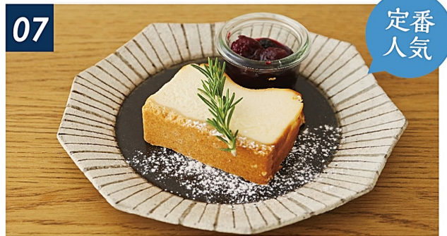
07 濃厚♡バイクドチーズケーキ ¥700 しっとり濃厚な自家製チーズケーキ。ベリーソースで味変も楽しめます。